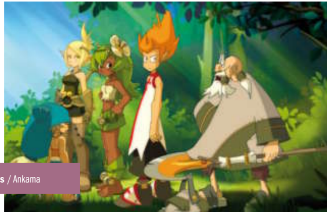
Les Cinq Magnifiques / Ankama