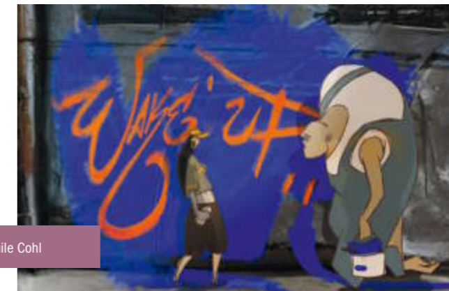
Wake Up / École Émile Cohl

➔ Retrouvez le programme au jour le jour du Forum des images p. 68