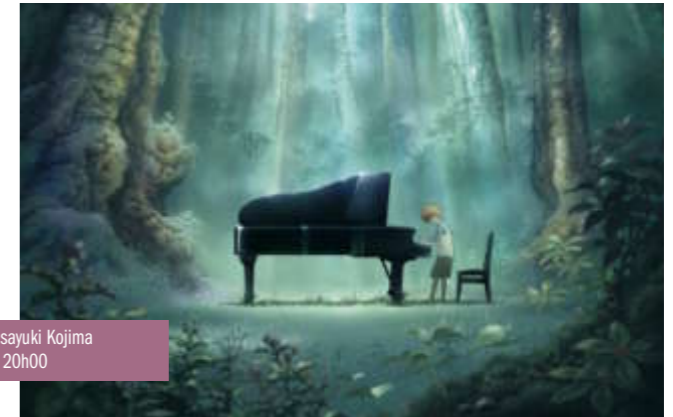
Piano Forest de Masayuki Kojima le vendredi 20 mars à 20h00

Deux rencontres avec des talents du jeu vidéo : samedi 21 mars, un dialogue entre Michel Ancel (concepteur) et Christophe Heral (compositeur) autour du jeu vidéo Beyond Good & Evil , et dimanche 22 mars, retour sur l'aventure exceptionnelle du studio Ankama et de ses productions Dofus, Dofus-Arena et Wakfu, en présence de son directeur de création et cofondateur, Anthony Roux.