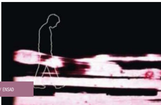
Celui qui... / ENSAD